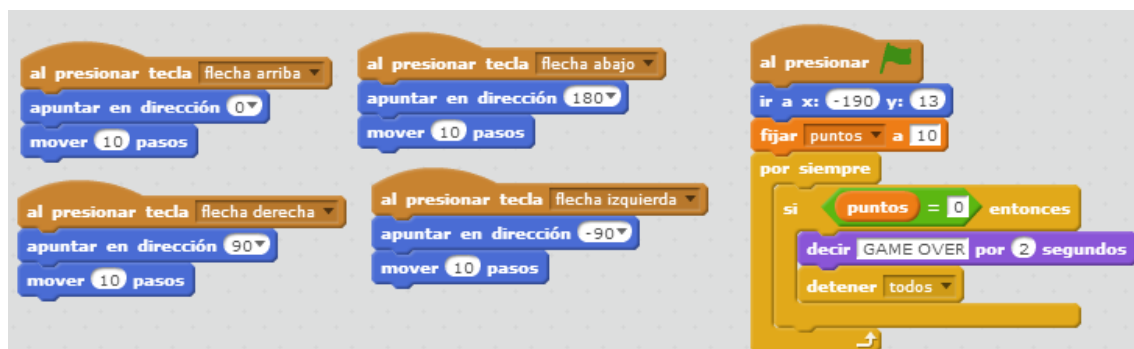
Código de la bruja.