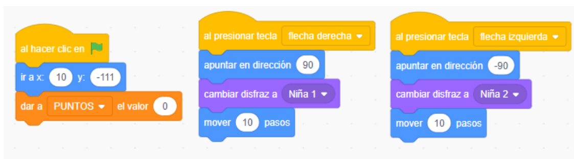
Código del personaje principal.